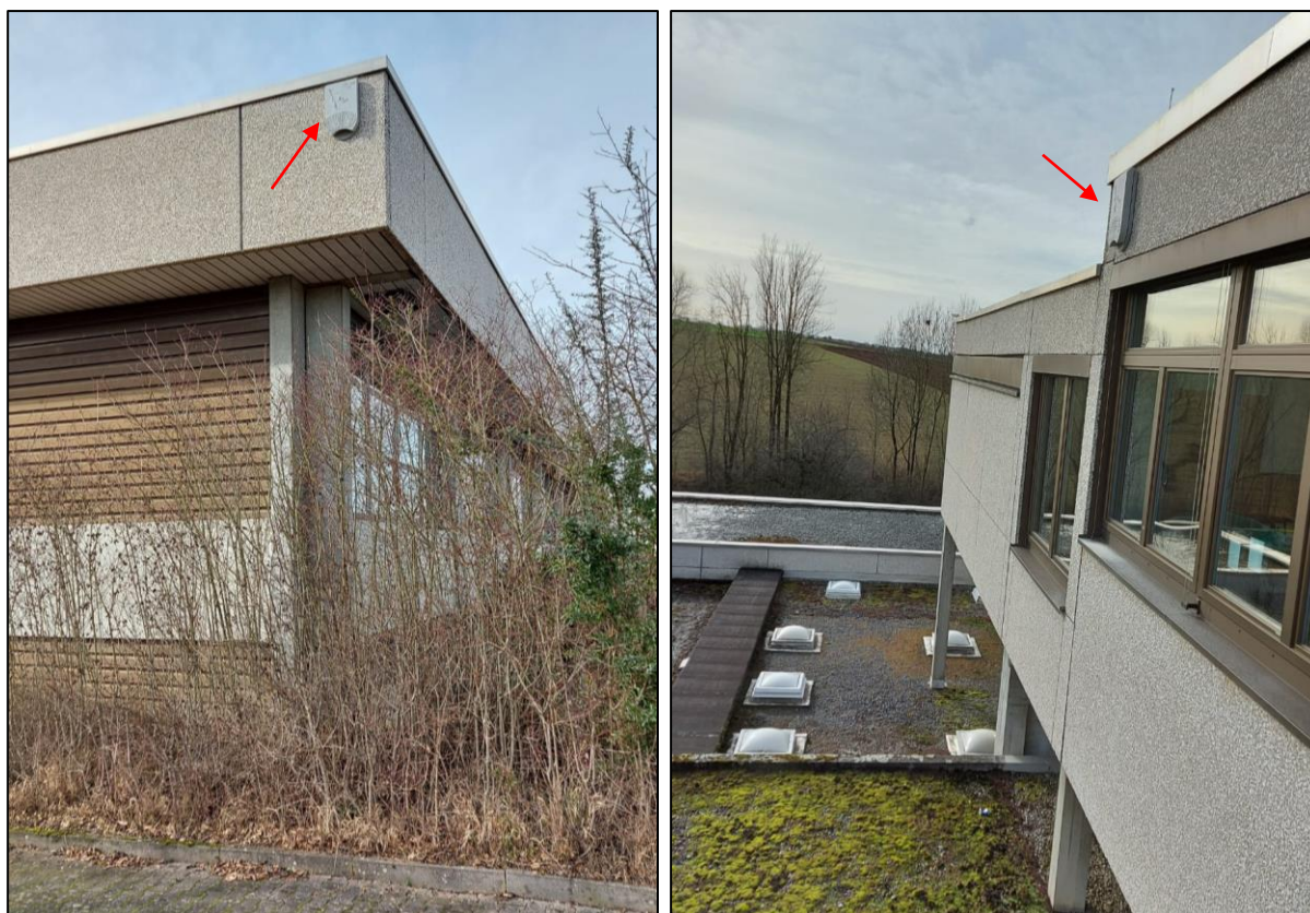
Abbildung 2: Hangplatz der Fledermausquartiere (roter Pfeil) an den Gebäuden der Kirchrainschule Oberboihingen.