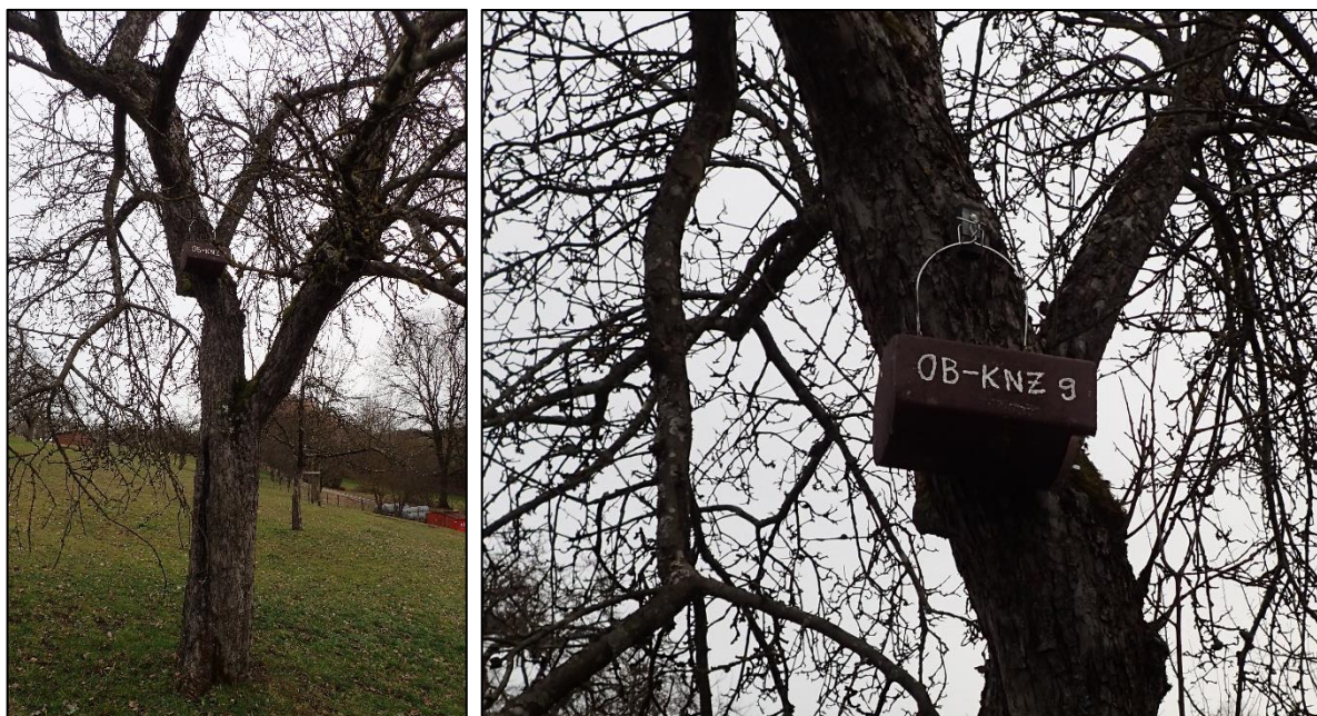
Abbildung 1: Hangplatz und Beschriftung der Vogelnisthilfe OB-KNZ V4 vom Typ 1N an einem Apfelbaum.