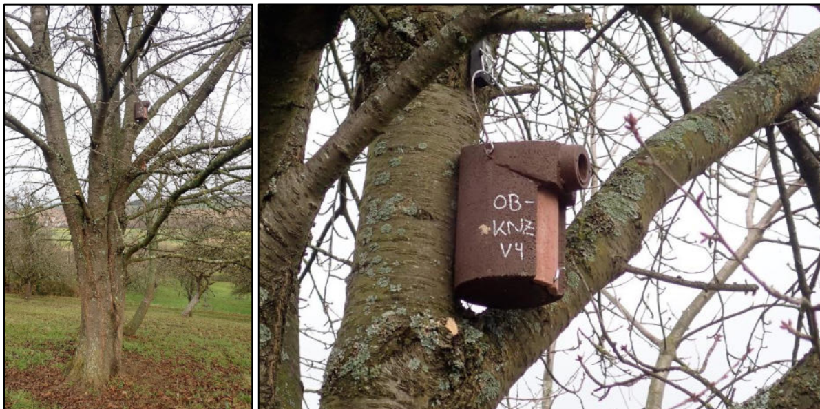
Abbildung 1: Hangplatz und Beschriftung der Vogelnisthilfe OB-KNZ V4 vom Typ 3SV, Durchmesser 45 mm an einer Kirsche.